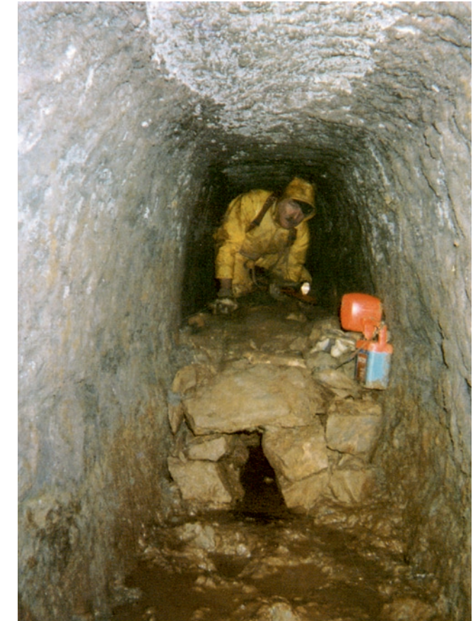
Canalisation en pierres sèches au point de départ du qanat, à 19 m de profondeur