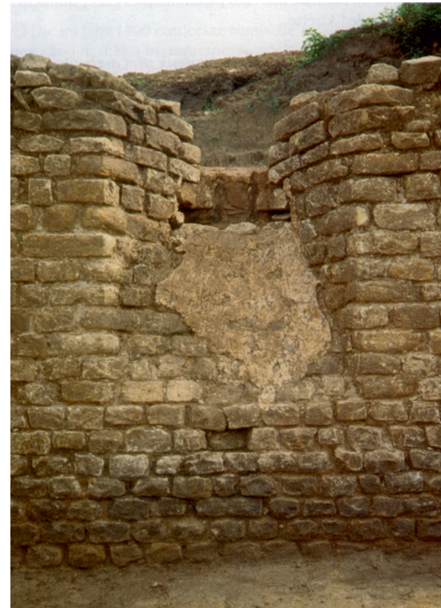
Lichtschaft des großen Kellers im Südost-Flügel der römischen Villa