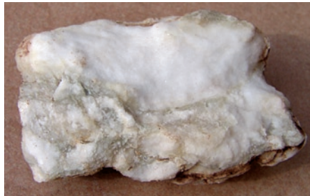
Echantillon de gypse extrait de la mine du Plakegebiërg